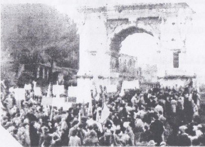
שער טיטוס, רומא, תש"ח